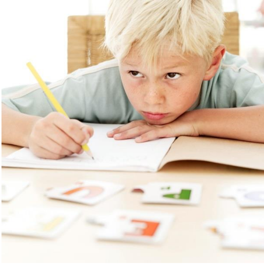
Un chico rubio. En ljushårig pojke