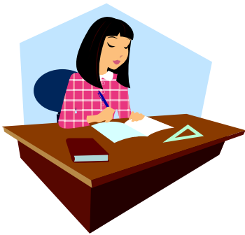
Una chica morena. En mörkhårig flicka