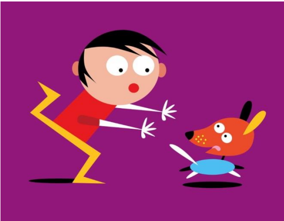
Un chico moreno. En mörkhårig pojke.